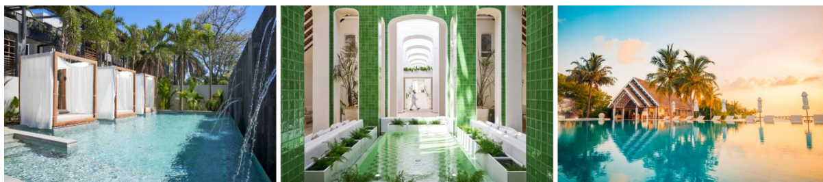
De gauche à droite : LUX* ME Spa à LUX* Grand Baie (Maurice), le Lobby de LUX* Belle Mare (Maurice) et la piscine Senses à LUX* South Ari Atoll (Maldives)

établissements hôteliers, nous continuons à nous concentrer sur la création d'expériences véritablement extraordinaires. »